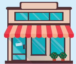
個人経営のお店 (飲食店など)